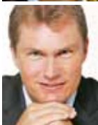
Daubenmerkl, Bernd Eurosport Media