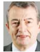
Niersbach, Wolfgang DFB