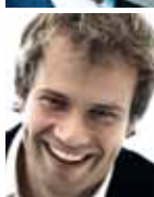
Müller, Martin U. „Der Spiegel“