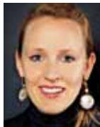
Hopfen, Donata Bild digital