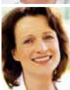
Freitag, Dagmar Sportausschuss Deutscher Bundestag